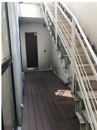
地下1階への直接階段